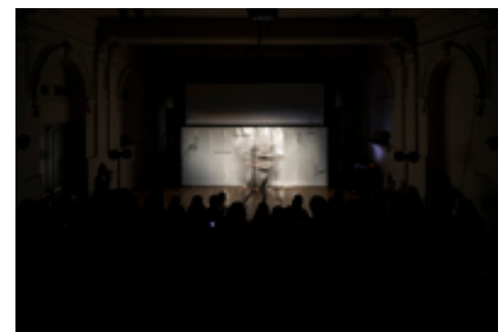
La instalación se vuelve una provocación para el movimiento de individuos, para observar cómo reaccionan sus cuerpos ante el sonido análogo, las sombras y los circuitos.