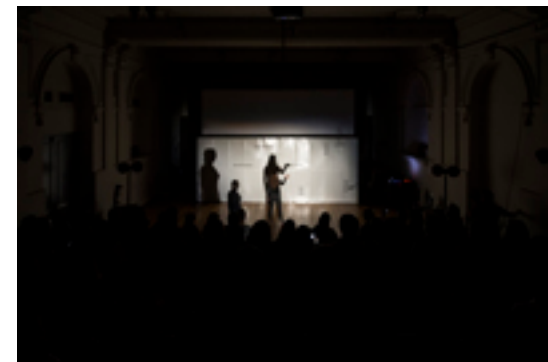
Una investigación sobre el lenguaje del cuerpo humano y la búsqueda de sus propias expresiones para hacer posible el acto dialéctico, busca el grupo interdisciplinario de artistas, Los Electros.