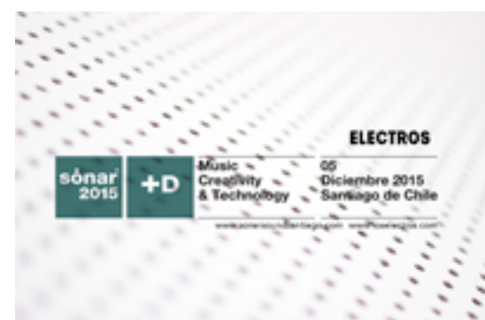
Así Proto Project, se integra al Festival Sónar Sound Santiago a través del Sonar+D, área que busca el intercambio de conocimientos, debate y reflexión sobre cultura digital y tecnologías creativas.